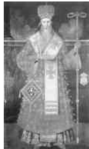
Арсеније III Чрнојевић

Сам град Нови Сад са околним насељима, као и другим крајевима јужне Бачке и обронцима Фрушке горе, богат је археолошким налазиштима из свих епоха