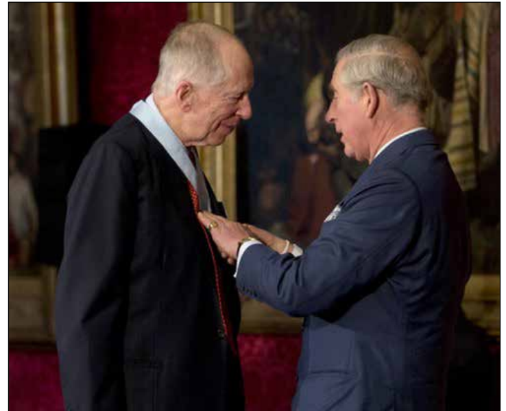
Јакоб Ротшилд и принц Чарлс

Важно је да запамтите да је главно оружје банкара новац, којим они поткупљују војну и безбедносну елиту неке земље, тако да она изда свог јаког лидера и свој народ. Сада вам је јасно зашто је Стаљин, с времена на време, ликвидирао камарилу око себе.