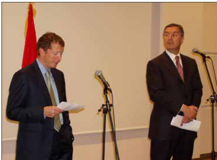
Нејтан Ротшилд, покровитељ Мила Ђукановића у име свог оца Јакоба

Хрвата и Албанаца или је нова верзија лажног цара који државу сигурно гура у пакао.